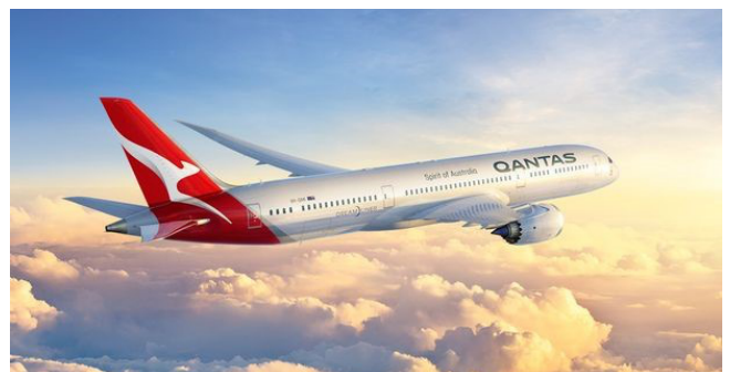
Përshtati në shqip: B. Hazizaj

Linjat ajrore u vlerësuan gjithashtu për protokollin e tyre Covid-19 përmes një numri faktorësh, përfshirë informacionin në faqen e linjave ajrore për koronavirusin, furnizimin me maska të fytyrës për pasagjerët dhe PPE për ekuipazhin, ndryshimin e shërbimeve të ushqimit, pastrimin e thellë të avionit, furnizimin me pajisje personale për pastrim dhe distancimin shoqëror në bord. ■